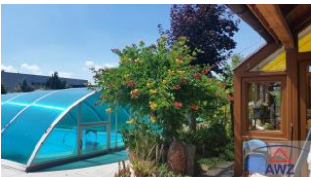
Terrasse zum Pool